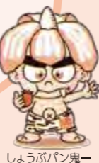
しょうぶパン鬼一